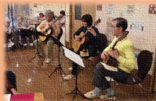
今回はギター演奏会がありました。とても楽しく聞かせて頂きました。

オレンジカフェ営業中 毎月第3金曜日 10時～12時 会費 100円 (飲み放題?! お菓子付き)