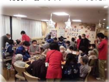
収穫祭(芋煮会/感謝祭)を開催。家族様やボランティア、総勢51名の大イベントでした!!

オレンジカフェ営業中 毎月第3金曜日 10時～12時 会費 100円 (飲み放題?! お菓子付き)