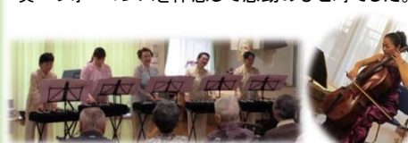
11月は2本立て!! チェロもチャイムも素晴らしい演奏パフォーマンスを体感して感動のひと時でした。

ヴィオラコンサート 大正琴? ヴァイオリン? まあ聴いてみましょう 平成29年1月15日(日) 14:00～15:00 サ高住みずほにて