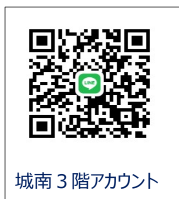
城南 3 階アカウント