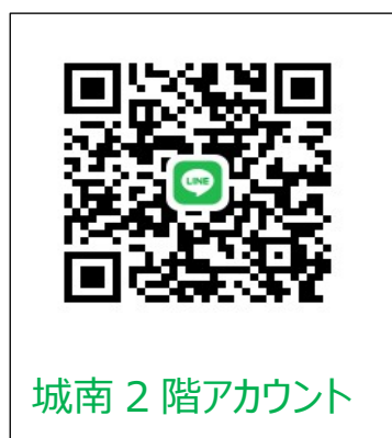
城南 2 階アカウント