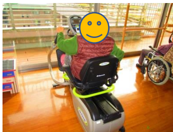
< マシンを使った運動の様子 >