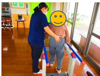
< 歩行練習の様子 >