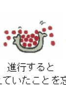
進行すると (覚えていたことを忘れる)

認知症が進行すると溜め込んでいた記憶の器が上の方から溶けはじめ、ポロポロと記憶の玉がこぼれ落ちていきます