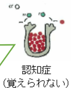
認知症 (覚えられない)

認知症になると触手はなくなり、新しい情報を取り込むことも自由に出し入れすることも困難に